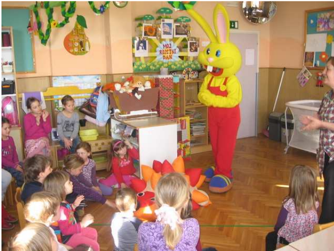
Vrtec v Lokavcu je obiskal Sparky