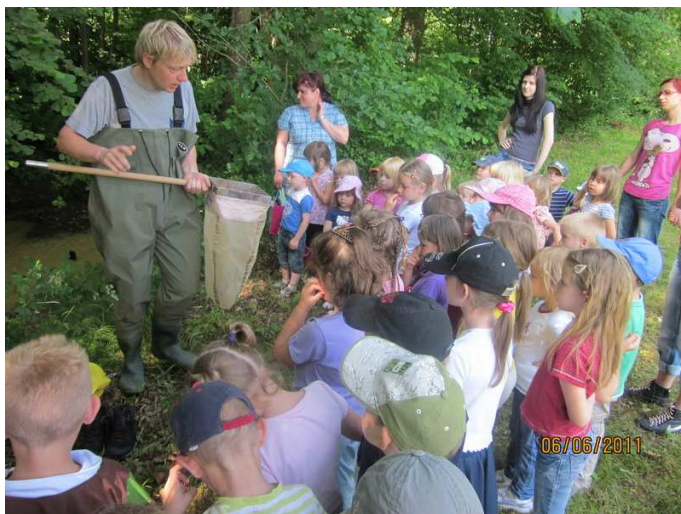
Naravoslovni dan ob reki Ščavnici

Kajenje, uživanje in ponudba alkoholnih pijač in drog ter drugih psihoaktivnih sredstev je v prostorih in na pripadajočem funkcionalnem zemljišču vrtca strogo prepovedano.